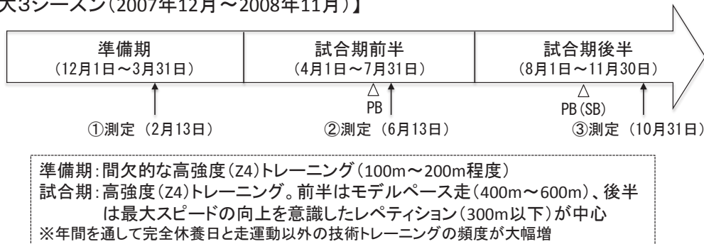
図2 S選手の期分け毎の走トレーニング課題と主な内容